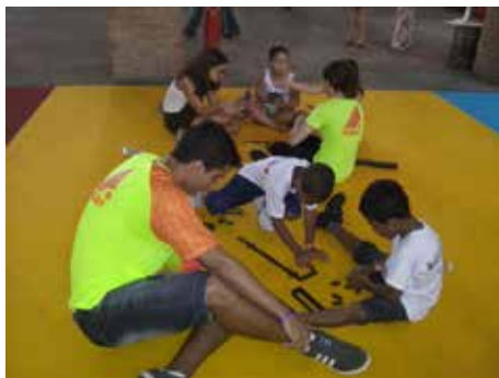
Fome de Leitura