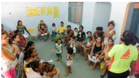
Creche Comunitária Parque Unidos de Acari | Total de 60 crianças beneficiadas

O intuito do projeto é, através do investimento financeiro à instituição cadastrada/escolhida, proporcionar melhores condições para o desenvolvimento integral das crianças, além de capacitar as educadoras da creche através da formação continuada com orientação de pedagogos, da participação nas palestras do Benefício Educação Continuada,