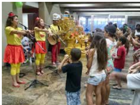
Vozes do Coração