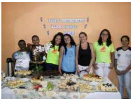
Centro Comunitário de Acari