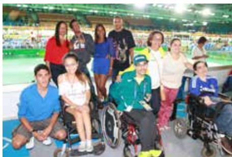
Dia Nacional da Pessoa com Deficiência