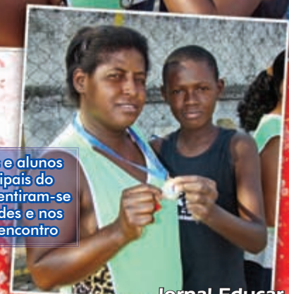
A integração entre pais e alunos foi um dos focos principais do evento. Mães e alunos sentiram-se orgulhosos, nas atividades e nos resultados ao final do encontro